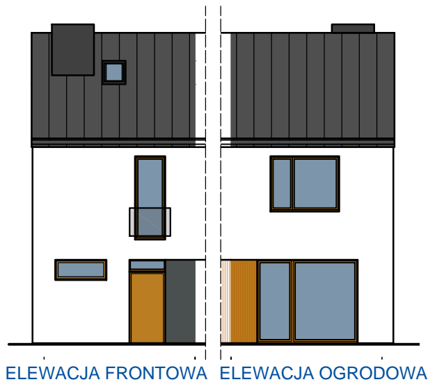
ELEWACJA FRONTOWA ELEWACJA OGRODOWA