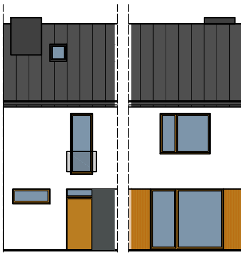
ELEWACJA FRONTOWA ELEWACJA OGRODOWA